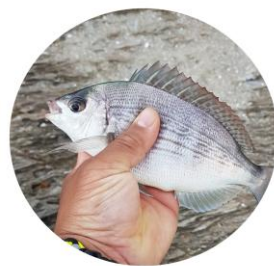
Taille légale de capture : 23 cm

Omnivore, elle se nourrit de vers, petits crabes, coquillages et autres proies enfouies. Elle offre de belles sensations en surfcasting grâce à ses touches franches.